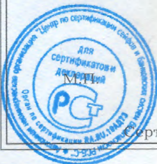
Схема сертификации - 1с